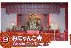
9 おにゃんこ寺 Goblin Cat Temple