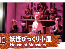
10 妖怪びっくり小屋 House of Monsters