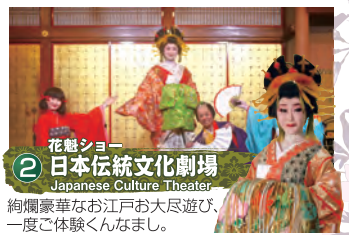
2 花魁ショー 日本伝統文化劇場 Japanese Culture Theater