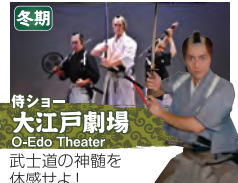
冬期 侍ショー 大江戸劇場 O-Edo Theater