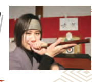
6 遊戯館 Yugi-Kan