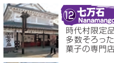
12 七万石 Nanamangoku