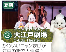
3 夏期 ニャンまげコメディ 大江戸劇場 O-Edo Theater