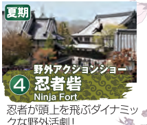
夏期 野外アクションショー 忍者砦 Ninja Fort