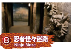
8 忍者怪々迷路 Ninja Maze

お殿様やお姫様に変身して記念撮影! 写真はその場ですぐお渡します。一日中村内を着て歩ける貸衣装も各種ご用意!