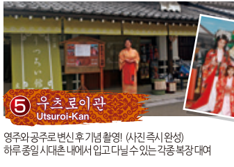
5 우츠로이관 Utsuroi-Kan 영주와 공주로 변신 후 기념 촬영 (사진 즉시 완성) 하루 종일 시대촌 내에서 입고 다닐 수 있는 각종 복장 대여