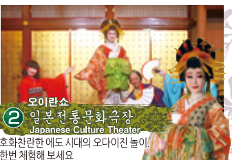
2 일본전통문화극장 Japanese Culture Theater 호화찬란한 에도 시대의 오다이진 놀이, 한번 체험해 보세요