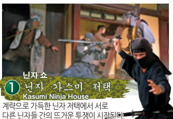
1 닌자 가스미 저택 Kasumi Ninja House 계략으로 가득한 닌자 저택에서 서로 다른 닌자들 간의 뜨거운 투쟁이 시작된다.