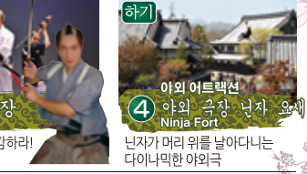
4 야외 극장 닌자 요새 Ninja Fort 닌자가 머리 위를 날아다니는 다이나믹한 야외극