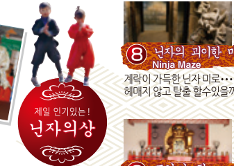
8 닌자의 괴이한 미로 Ninja Maze 계략이 가득한 닌자 미로... 헤매지 않고 탈출 할수있을까요?