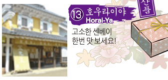
13 호우라이야 Horai-Ya 고소한 센베이 한번 맛 보세요!