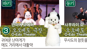
3 오에도 극장 O-Edo Theater 귀여운 난바게가 에도 거리에서 대활약