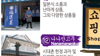
11 후쿠토쿠야 Fukutoku-Ya 일본식 소품과 난바게 상품, 그의 다양한 상품들